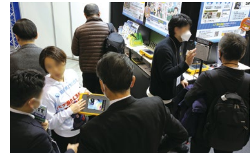
2023年開催のSMART ENERGY WEEKより